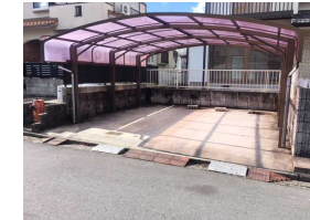
カーポート2台分あります！